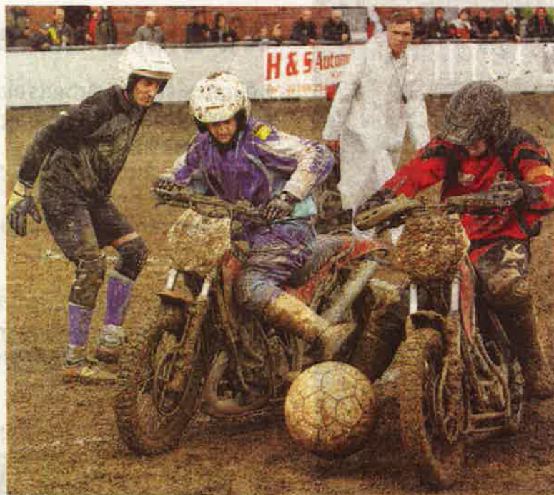
Motoball wird mit einem großen Fußball auf Sand und mit Cross-Maschinen gespielt.